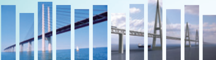
Brücke zwischen Kopenhagen und Malmö (Strassen- und Schienenverbindung)

In Ländern mit hohen Produktionskosten haben die Verkehrsinfrastrukturen einen direkten Einfluss auf die Wirtschaftsleistung. Ihre effiziente Verfügbarkeit kann ein äußerst wichtiger Faktor beim Kampf gegen Standortverlagerungen ins Ausland bzw. bei der Schaffung von Anreizen für eine Rückverlagerung sein. Doch wie gestalten sich vor dem Hintergrund der Verknappung öffentlicher Ressourcen und des Widerstands von Interessengruppen Handlungsspielräume und Erfolgchancen?