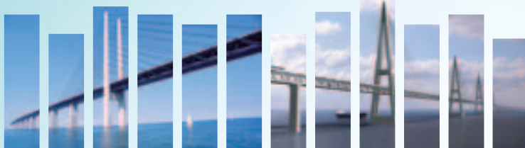
Pont routier et ferroviaire entre Copenhague et Malmö

Dans les pays à coûts de production élevée, les moyens de transport impactent directement la performance économique. Leur disponibilité efficace peut être un élément fort de lutte contre la délocalisation ou d'encouragement à la relocalisation. Mais, entre raréfaction de l'argent public et oppositions de groupes de pression, quels sont les facteurs de réussite et les marges de manœuvre ?